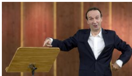
Roberto Benigni ha parlato di lavoro, religione e cultura

La passione e l'emozione non ha fatto trascurare la poesia, la favola, la parabola. Due ore abbondanti senza pubblicità, in un programma ricco di senso, che proprio nella sua prima parte, quella dedicata alla satira su Berlusconi, ha avuto il momento meno rilevante. Due ore abbondanti senza pubblicità. Un piccolo grande miracolo di Natale.